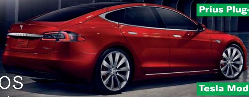
Tesla Model S