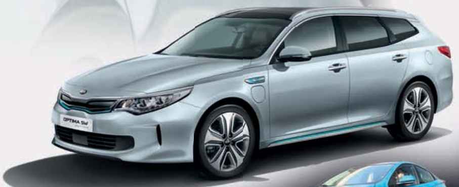
KIA Optima SW Plug-in-Hybrid